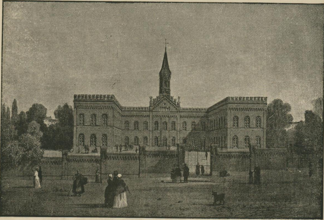
L'HOSPICE DES AVEUGLES DE LA SOCIÉTÉ ROYALE DE PHILANTHROPIE. D'après la lithographie de G. Vander Hecht (1855).

Ainsi, peu à peu, par gradations successives, on modifia l'ancien aspect de l'extrémité méridionale de la ville, diminuant son cachet pittoresque et accidenté dans un intérêt de salubrité et d'hygiène publique. La porte de Hal n'en resta pas moins un point de circulation animée et de paysage riant et varié.